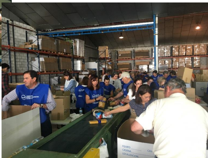
Voluntarios y voluntarias en el almacén del Banco de Alimentos de Sevilla clasificando los alimentos recogidos