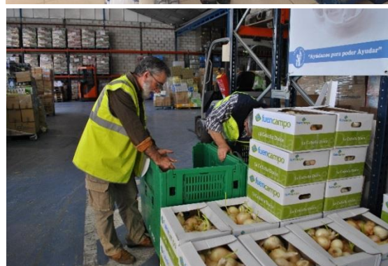
Voluntarios del Banco de Alimentos realizando tareas en la Gran Recogida y en el almacén