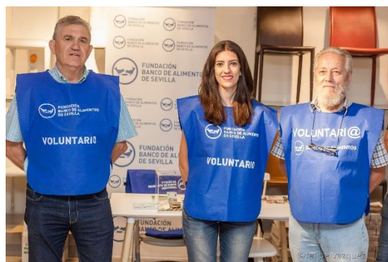
Voluntarios y voluntarias en la recogida de dorsales de la Nocturna del Guadalquivir