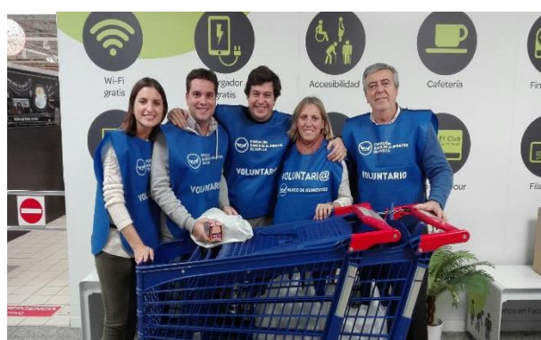
Voluntarios y voluntarias durante la Gran Recogida celebrar el 1 y 2 de diciembre en los diferentes puntos de recogidas