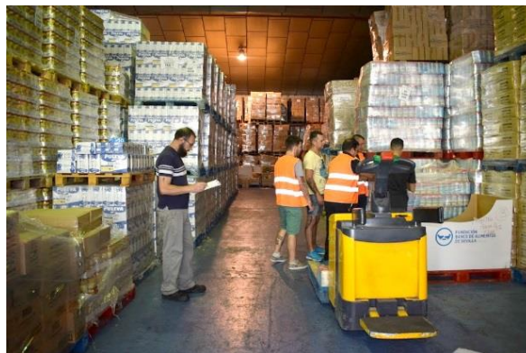
Mozos de almacén realizando reparto de los alimentos FEADS

En contacto permanente con las instituciones colaboradoras, el BAS conoce sus necesidades y, en función de sus existencias, les asigna cantidad y tipos de alimentos. Para ello, se ocupa de la gestión de stocks, siendo responsable de la recepción de los alimentos, de su buena conservación en los almacenes, de su rotación y preparación de los pedidos.