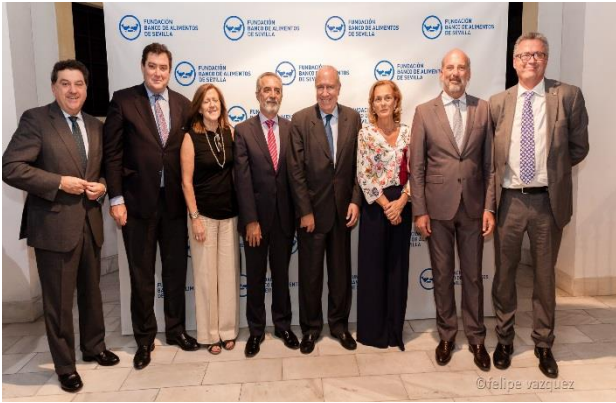
Miembros del equipo directivo de la Fundación Banco de Alimentos de Sevilla