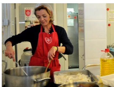
Cocinera preparando el almuerzo en el comedor de la Orden de Malta