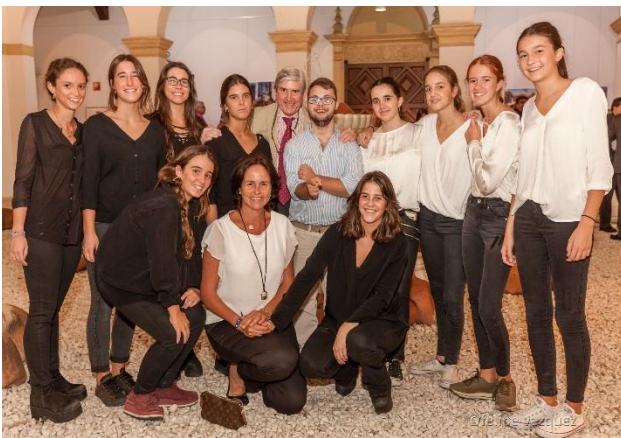
Grupo de jóvenes voluntarios y voluntarias que ayudan al servicio de catering