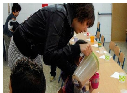
Asociación Gota de Leche de Sevilla sirviendo los desayunos saludables