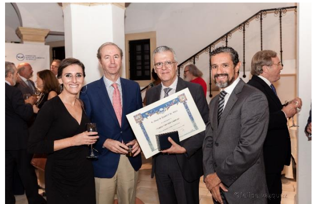
Directivos del grupo empresarial Carrefour de España y Fundación Solidaridad Carrefour