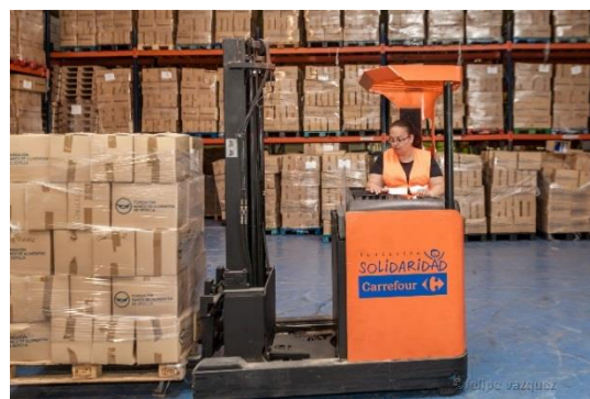
Alumnos/as del curso de formación en actividades auxiliares de almacén realizando prácticas en las instalaciones del BAS