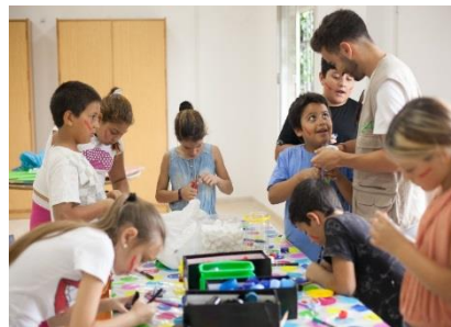
Talleres infantiles de la Asociación Entre Amigos de Sevilla