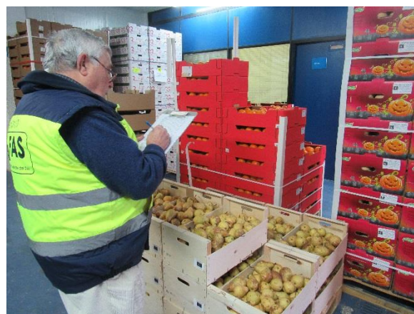
Voluntario realizando el reparto de frutas, verduras y hortalizas en el almacén de Mercasevilla

1.955.513,16 kilos se han repartido a través del programa FEADS en 2017