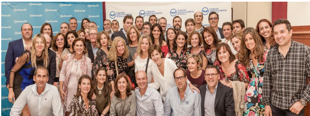
Jugadores y jugadoras del VII Torneo de Pádel y Tenis de la Fundación Banco de Alimentos de Sevilla en la entrega de trofeos en el Club de Campo Sevilla.