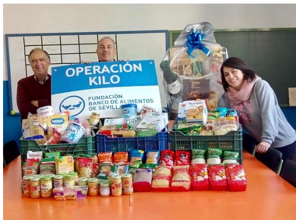
Operación Kilo en centros educativos de Sevilla y Provincia

357 Operaciones kilos llevadas a cabo por los centros educativos de Sevilla y Provincia