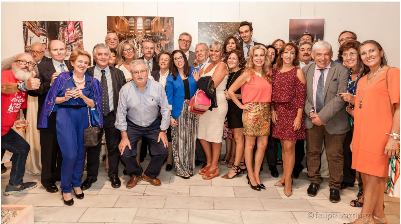
Grupo de voluntarios y voluntarias, junto con el personal técnico, en el acto institucional del Banco de Alimentos de Sevilla en la Fundación Valentín de Madariaga