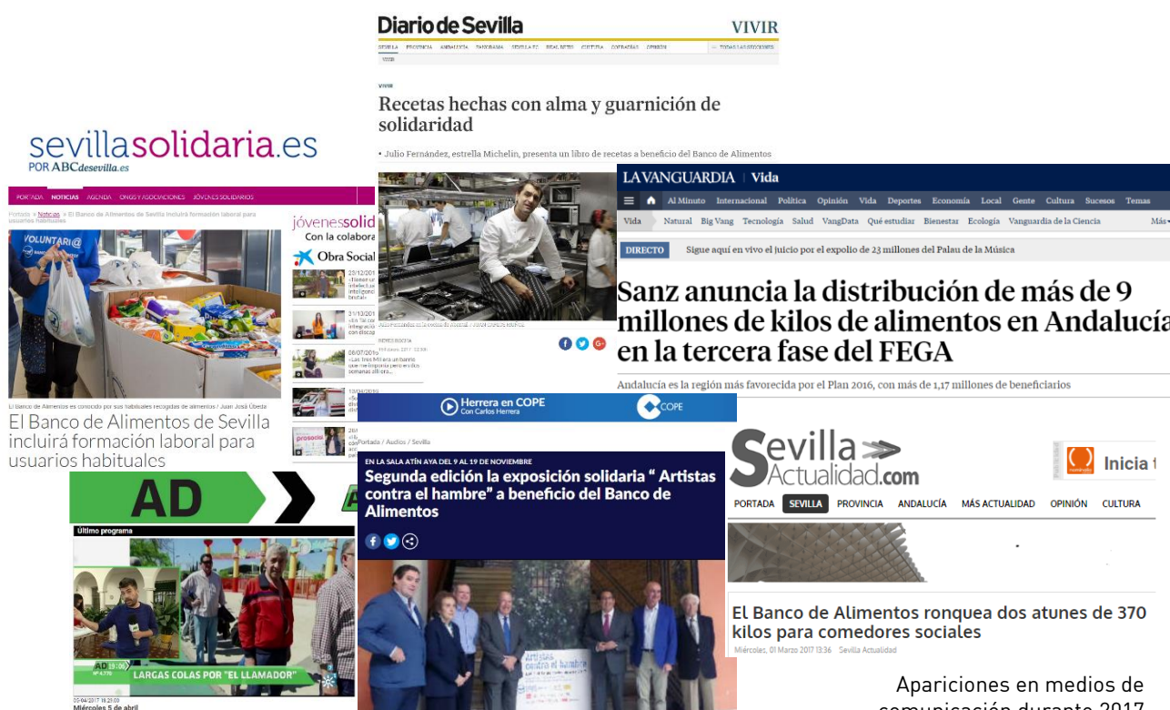
Apariciones en medios de comunicación durante 2017