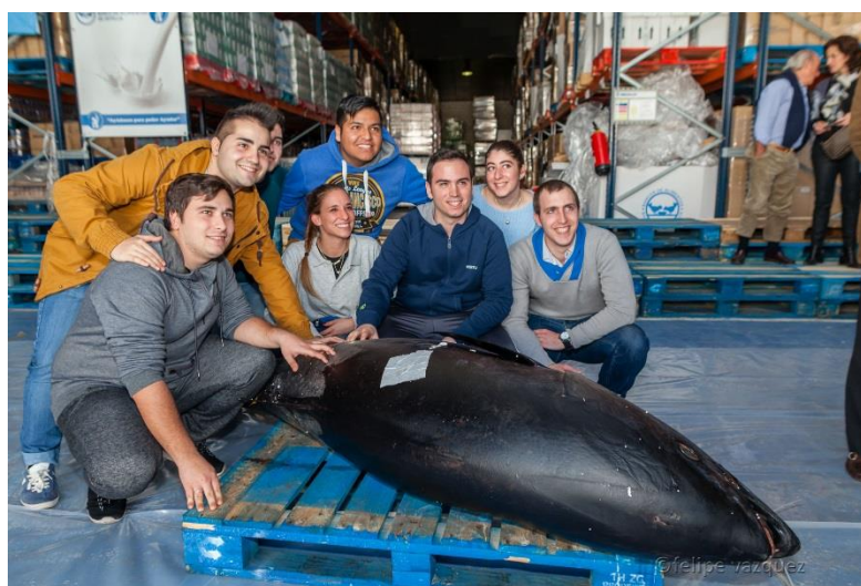
Alumnos/as de las escuelas de hostelería de Sevilla durante el ronqueo de dos atunes en el Banco de Alimentos de Sevilla.