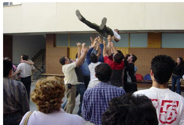
Usuarios de la Comunidad Terapéutica Residencial de Proyecto Hombre Sevilla