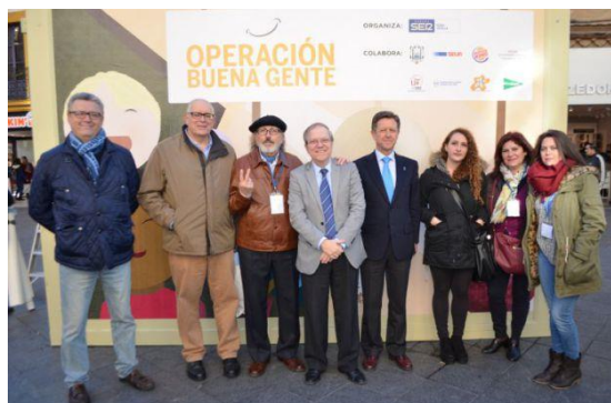
Presentación de la Campaña Operación Buena Gente llevada a cabo por la Cadena Ser y el Ateneo de Sevilla