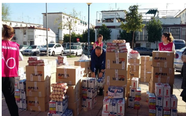
Asociación PRODEAN, organización asociada de reparto, realizando la distribución de alimentos a los beneficiarios.