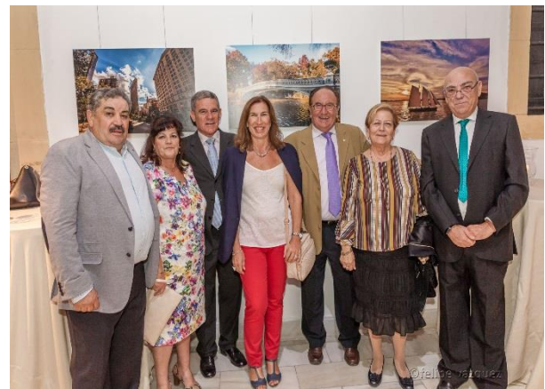
Voluntarios y voluntarias encargados del reparto de alimentos en Mercasevilla