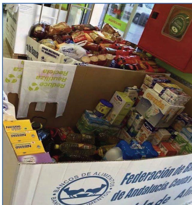
Cajas repletas en un supermercado del centro de Sevilla.